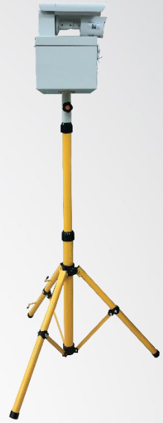
(※此為展示圖·傳輸站 不含攝影機·攝影機可另購)